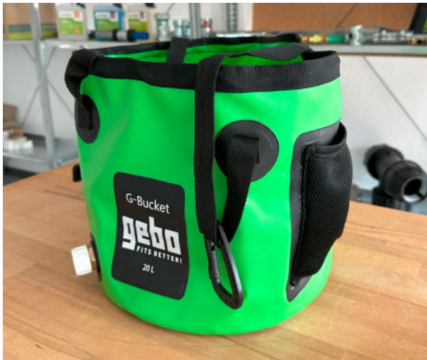
G-BUCKET ELASTYCZNY I WSZECHESTRONNY

Czy to na placu budowy, w serwisie czy podczas napraw - G-Bucket wspiera Cię w każdej sytuacji!